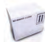
Caixa com 6 garrafas de 1 litro